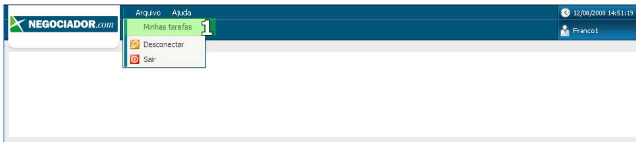
TELA 3 – MINHAS TAREFAS

Nesse momento, o aprovador deve selecionar na lista, a negociação que deseja aprovar. Selecionada a cotação a ser confirmada, o usuário deverá clicar, no campo grifado (1) da Tela 4, em "APROVAR" para gerar o pedido de compra ao fornecedor. Atenção: após aprovação, não poderá ser alterada nenhuma posição da proposta, cabendo ao comprador cumprir suas obrigações de pagamento conforme acordado na negociação.